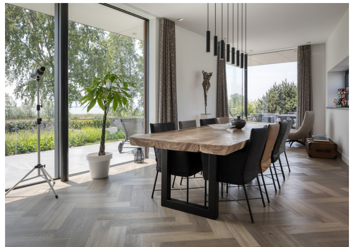
PalletWood Interiors leverde de boomstamtafel met bijpassende stoelen.