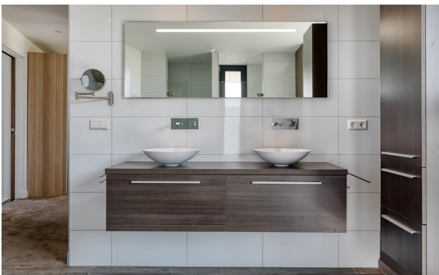
De badkamer is compleet veranderd in een modern geheel.

De leefkeuken, living, eetkamer en tv-kamer zijn in een open plattegrond vormgegeven, waarbij een sfeervolle haard zorgt voor een subtiele onderbreking en knusheid.” De achterzijde van de verdieping is volledig in glas uitgewerkt, zodat er een ultieme relatie met de buitenomgeving is ontstaan. Op mooie dagen kan de wand grotendeels open worden geschoven, waardoor binnen en buiten letterlijk in elkaar overgaan. Vanuit de aangrenzende tuin, met een prachtig terras en een zwembad, genieten de bewoners van een uniek uitzicht op het natuurgebied en het meer. “Leuk detail is dat aan de buitenzijde een overstek is gemaakt”, aldus Richard. “De grootte hiervan hebben we bepaald door middel van een zonberekening. Hierdoor komt er in ieder seizoen de perfecte hoeveelheid zonlicht binnen. In de winter wordt de woning hierdoor verwarmd, in de zomer gekoeld – een mooi voorbeeld van een duurzame oplossing.”