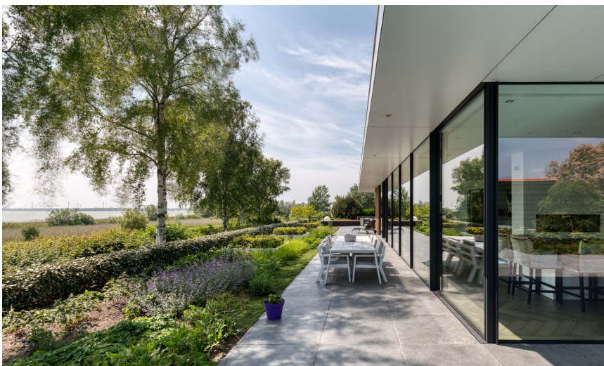
De schuifpuien, hoekpui en de deur op de begane grond werden gerealiseerd door Kumasol / KELLER minimal windows @.

Dit project werd mede gerealiseerd door: