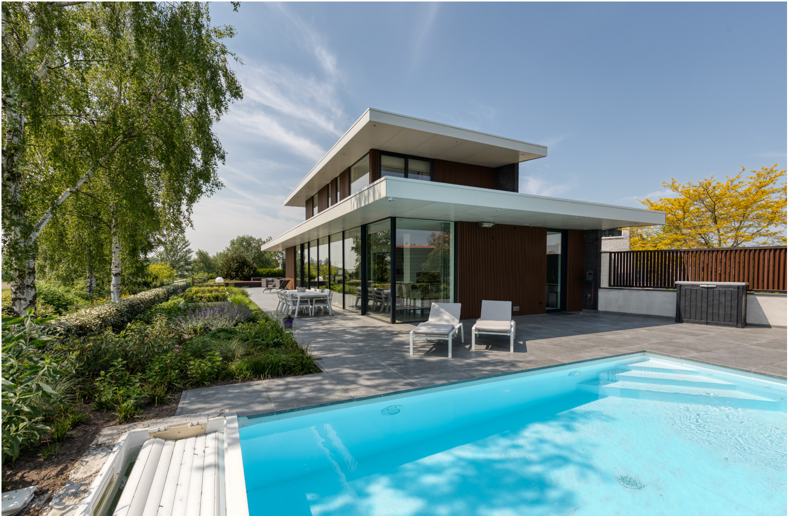
De tuin werd ontworpen en aangelegd door Visio Vireo Tuinen. Het buitenmeubilair is o.a. van Borek parasols | outdoor furniture.