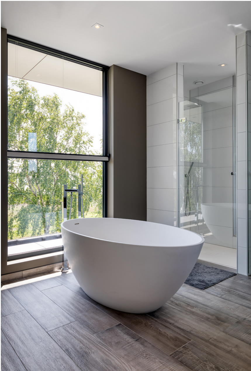
Zelfs op de badkamer staan de bewoners in contact met de omliggende natuur.

De leefkeuken, living, eetkamer en tv-kamer zijn in een open plattegrond vormgegeven, waarbij een sfeervolle haard zorgt voor een subtiele onderbreking en knusheid.” De achterzijde van de verdieping is volledig in glas uitgewerkt, zodat er een ultieme relatie met de buitenomgeving is ontstaan. Op mooie dagen kan de wand grotendeels open worden geschoven, waardoor binnen en buiten letterlijk in elkaar overgaan. Vanuit de aangrenzende tuin, met een prachtig terras en een zwembad, genieten de bewoners van een uniek uitzicht op het natuurgebied en het meer. “Leuk detail is dat aan de buitenzijde een overstek is gemaakt”, aldus Richard. “De grootte hiervan hebben we bepaald door middel van een zonberekening. Hierdoor komt er in ieder seizoen de perfecte hoeveelheid zonlicht binnen. In de winter wordt de woning hierdoor verwarmd, in de zomer gekoeld – een mooi voorbeeld van een duurzame oplossing.”