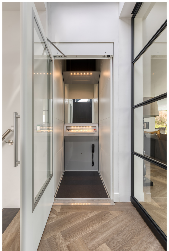
De verschillende etages zijn bereikbaar via de trap, maar ook via de huislift van MTH Liftechniek.