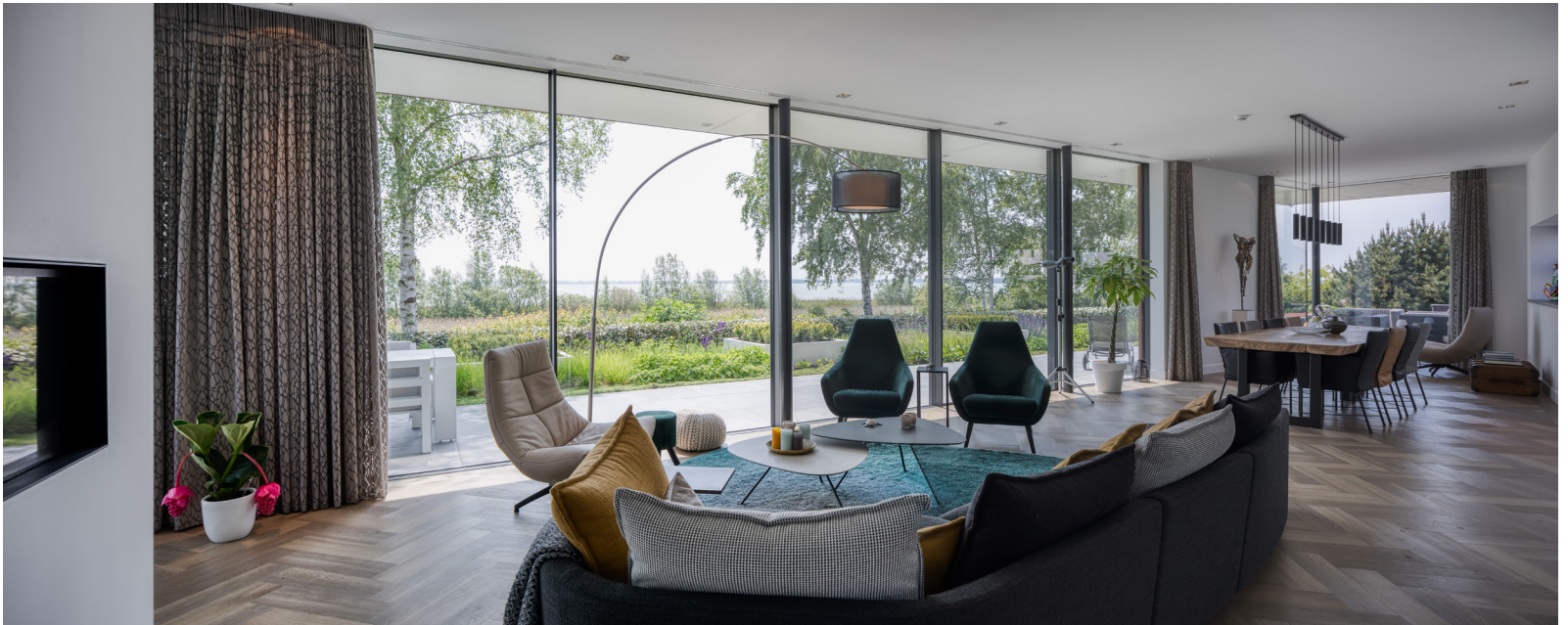
De woonkamer, eethoek en keuken vormen één knus geheel. De verlichting is van Maretti Lighting.