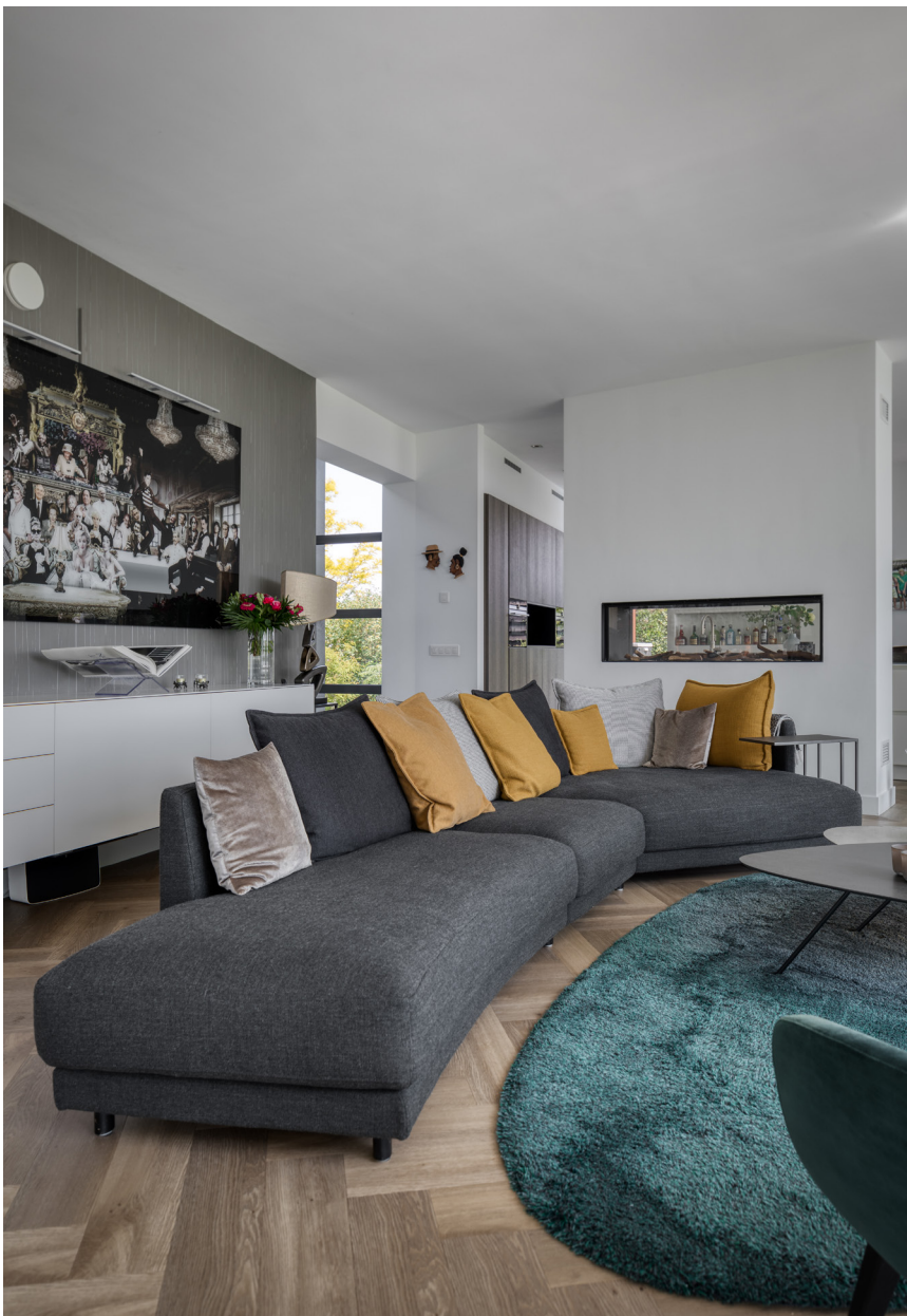
De foto van Cobra Art achter de bank werd geleverd door De Toren Interieurs.